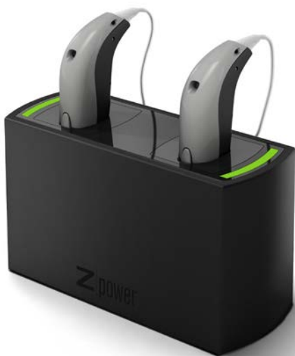
Zerena miniRITE с аккумулятором в зарядном устройстве.

Используя опцию перезарядки аккумулятора, Вы можете сэкономить время, которое Вы тратите для покупки и хранения батареек. Вам не нужно думать о смене батарейки каждые несколько дней. И Вы делаете что-то хорошее для экологии.