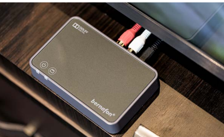
TV-A адаптер соединен с ТВ

Вы хотели бы, чтобы звук от Вашего ТВ поступал непосредственно в Ваши уши? Это возможно для слуховых аппаратов Zerepa и ТВ адаптеров. Смотрите ТВ на уровне комфортной Вам громкости и наслаждайтесь долби системой® качество Стереозвучания.