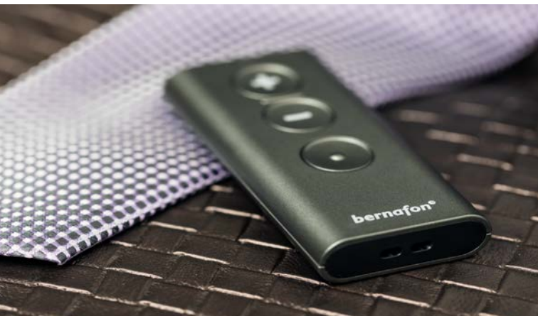
Bernafon RC-A дистанционное управление.

Также Вы можете регулировать уровень громкости и переключать программы с помощью простого в обращении