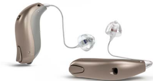
Bernafon Zerena miniRITE