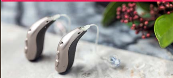
Стильная Zerena miniRITE T