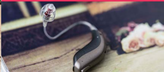
Миниатюрная Zerena miniRITE