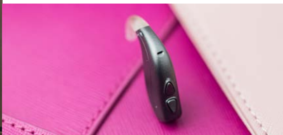
Мощная Zerena BTE 105

Доступен в трех стилях и девяти цветовых комбинациях, соответствует Вашим предпочтениям и дает возможность корректировать все типы снижения слуха.